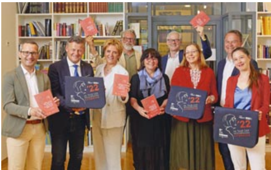
Große Vorfreude auf das literarische Großereignis bei den Veranstaltern und Preisstiftern des Ingeborg-Bachmann-Preises.