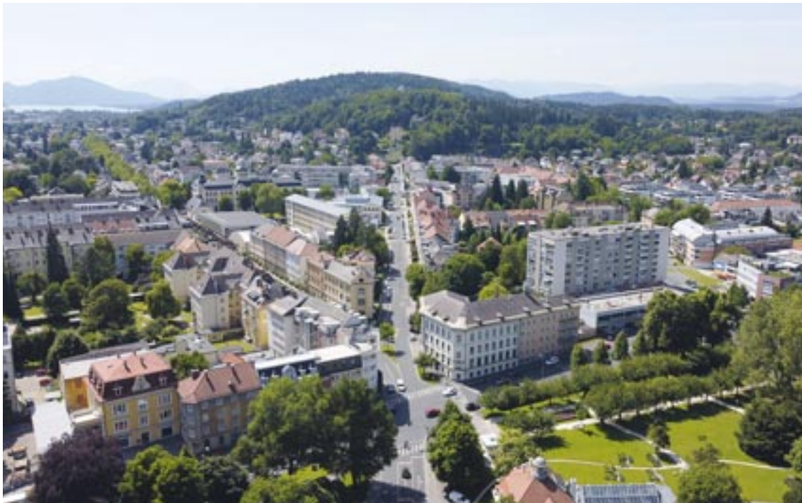
Klagenfurt ist seit Ende April eine von 100 Klima-Vorzeigestädten der EU.

„Fernkälte“ und Etablierung der Smart City Zielgebiete.