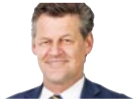
Christian Scheider Bürgermeister

„Klagenfurt wird im Sommer zu einer großen Freiluftbühne. ‚Donnerszenen‘, ‚AfterWorkMarkt‘ und Konzerte in den Gassen – es ist immer etwas los.“