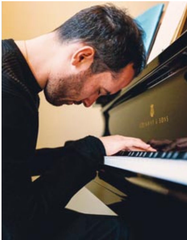
Klaviermatinee mit Igor Levit am 25. Juni ab 11 Uhr im Klagenfurter Burghof.

Wir verlosen Konzertkarten zu jedem Termin: Email mit dem Kennwort „Klassik im Burghof“ an stadtzeitung@klagenfurt.at