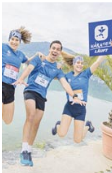
„Kärnten läuft“ kehrt in die Ostbucht zurück.