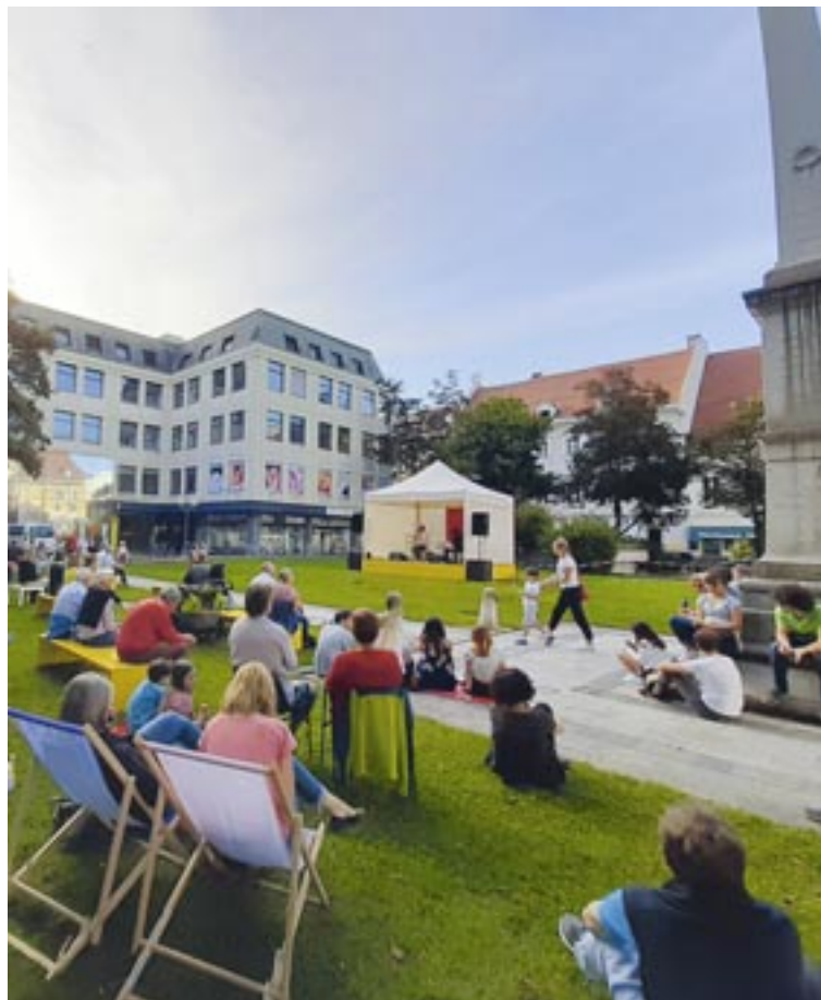
Gemütliches Ambiente bei den „Vierteltönen“ am Kardinalplatz.