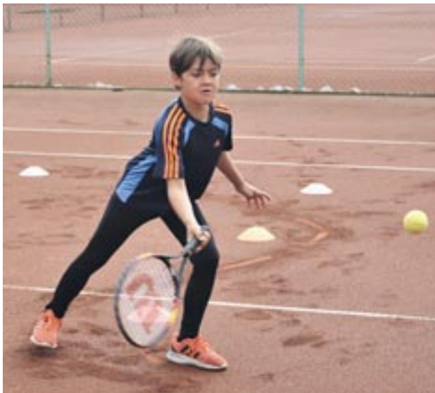
Skateboarden, Kajak, Tennis, Fußball oder BMX-Fahren – beim Klagenfurter Sommersportschnuppern können Kinder viele Sportarten kostenlos ausprobieren. Mehr dazu auf www.sportschnuppern-klagenfurt.at