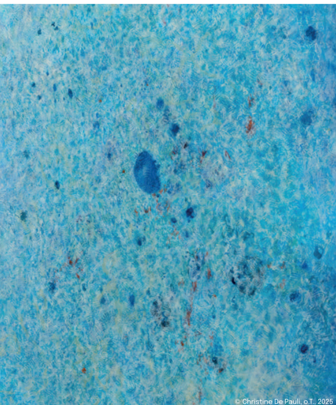
© Christine De Pauli, o.T., 2025