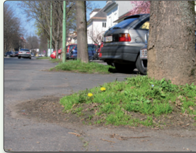
Baumscheibe mit Spontan-vegetation

Eine Besonderheit der straßenbegleitenden Vegetation stellen Baumscheiben dar. Sind diese nicht versiegelt – die Löcher in den Baumscheiben dienen dazu, dass Regenwasser in den Boden fließen kann, und gelegentlich auch Pflanzen herauswachsen können – kann sich unter Umständen eine Spon-tanvegetation entwickeln.