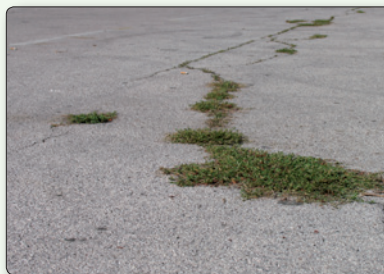
Lebensraum Asphalt Ritze

Die Pflanzen haben es in unseren asphaltierten, betonierten und gepflasterten Städten nicht immer leicht, sich zu entwickeln. Sofern die Bedingungen optimal sind und genügend Wasser vorhanden ist, können die Samen – die z. B. durch Ritzen unter die Asphalt- oder Betondecke transportiert wurden – ungestört keimen. Um jedoch an das Licht zu gelangen, müssen sie die Asphaltdecke oder sonstige versiegelte Decken durchbrechen.