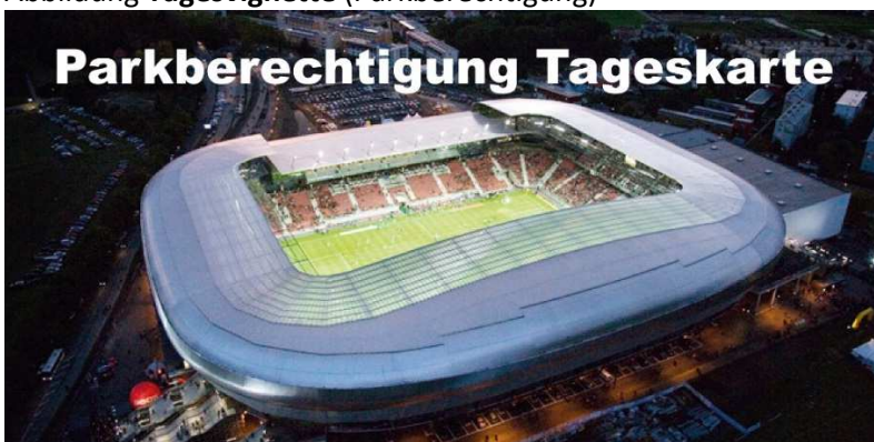
Abbildung Tages vignette (Parkberechtigung)