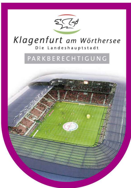
Abbildung Berechtigungs vignette (Parkberechtigung) bzw. Berechtigungs vignette neu (Parkberechtigung)