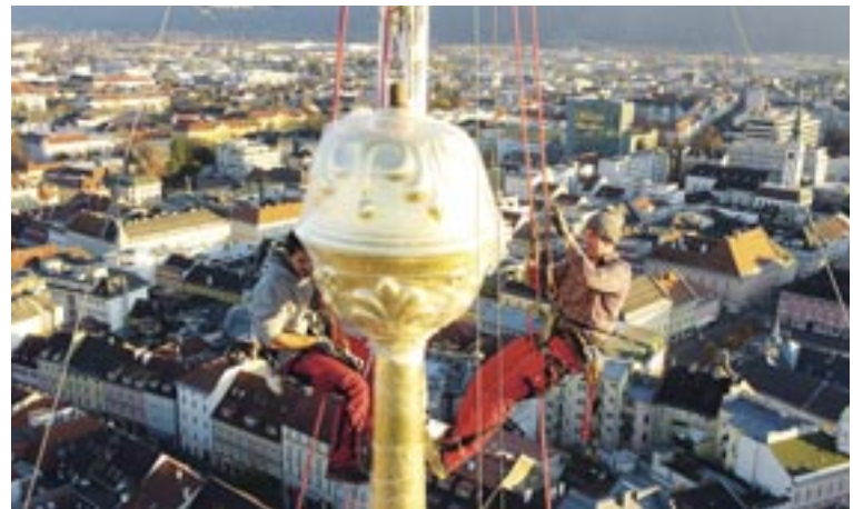
Auch beim Anbringen der Turmkugel musste jeder Handgriff sitzen.