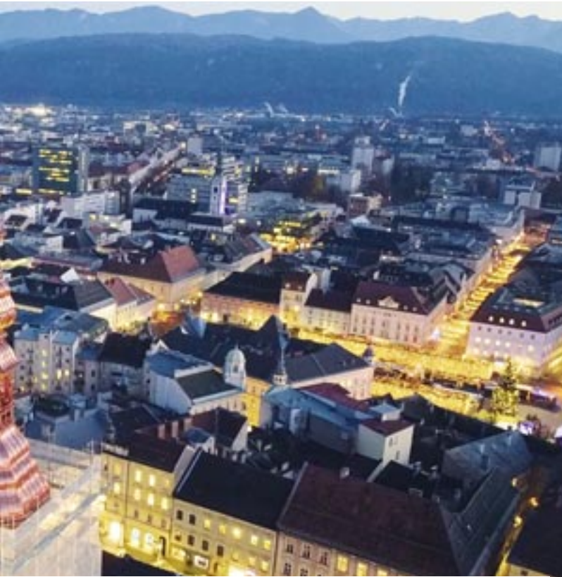
„Antlitz“ über den Dächern der Klagenfurter Innenstadt.