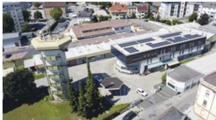
Die Berufsfeuerwehr in der Hans-Sachs-Straße bald unter neuer Leitung.