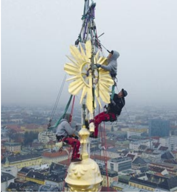
Spektakulär: Der Schein wird zur Turmspitze zurückgebracht.