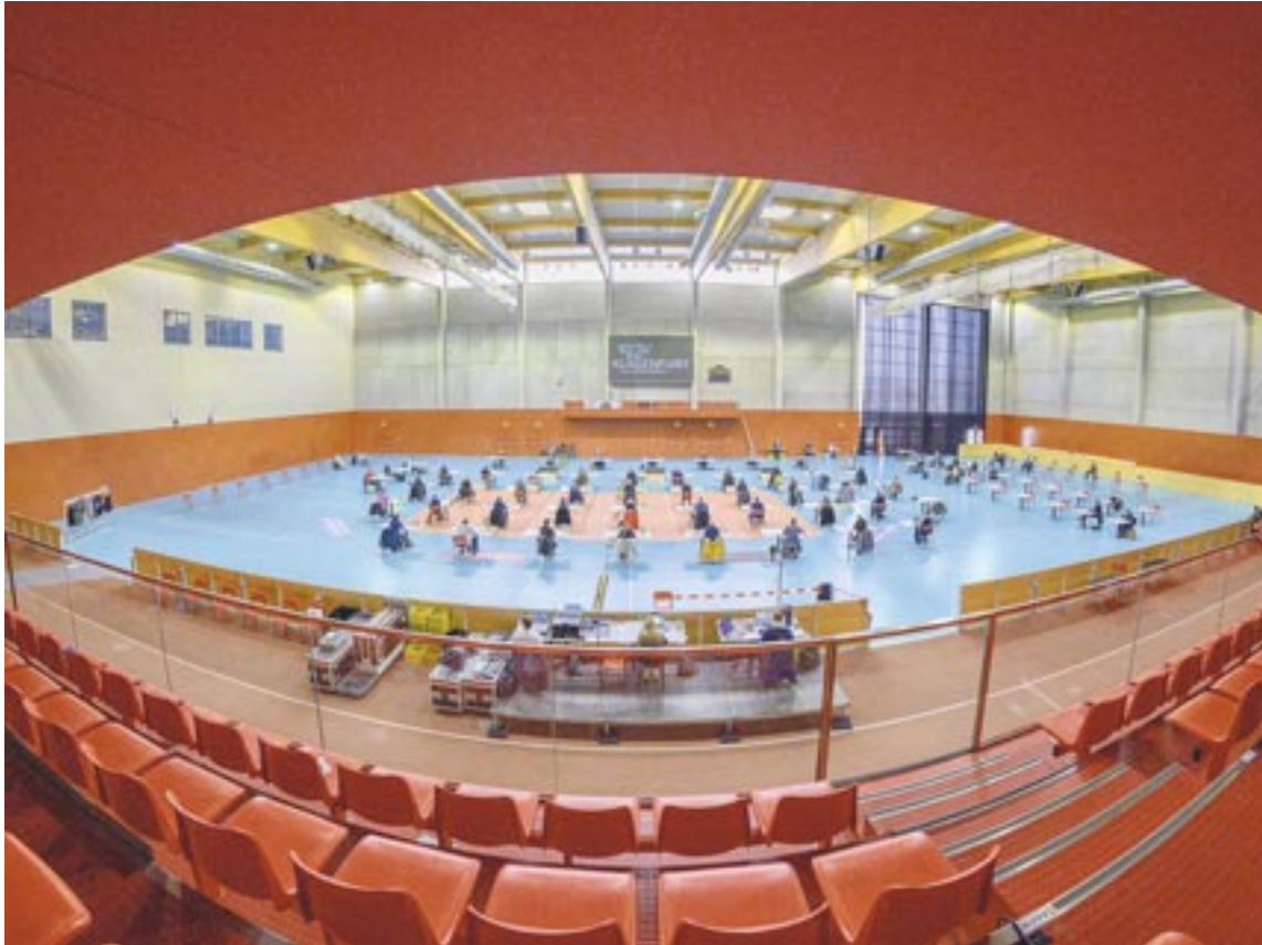
Das „Go!“ für das Karawankenblickbad am Südring fiel in der jüngst vergangenen Sitzung des Klagenfurter Stadtparlaments ganz in der Nähe des neuen Standortes: in der Ballspielhalle des Sportparks.