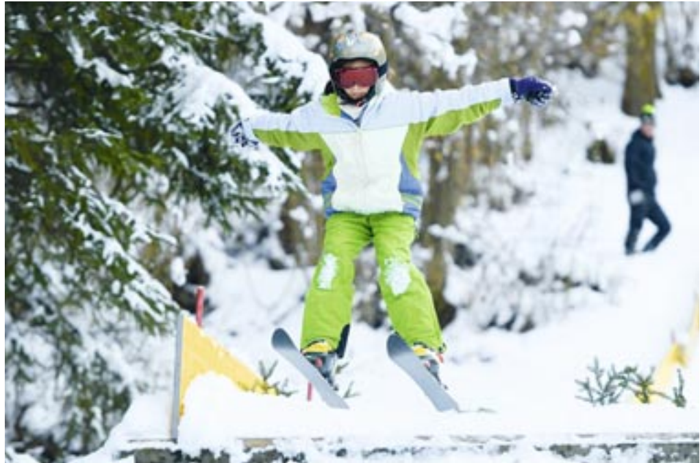
Auch Ski- springen ist im Pro- gramm mit dabei.

Die Jugendlichen der schulischen Tagesbetreuung der MS 13 – Viktring