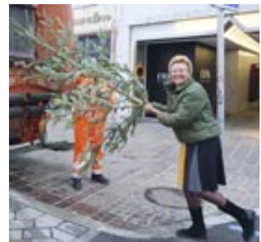
Bäume vor dem Entsorgen komplett abschmücken, da sie recycelt werden.

befreit hat, sollte man ihn nach Möglichkeit zerkleinern. Danach können die Baumreste in die Biotonne geworfen werden. Wer nun keine Möglichkeit hat, den Baum zu zerkleinern, der kann ihn auch weiterhin zu Müllsammelplätzen stellen. Aktuelle Abholtermine findet man in der Müll-App. Kein Baum wird von den Entsorgungsmitarbeitern zurückgelassen! DW