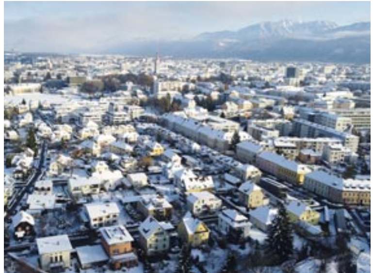
Klagenfurt verfolgt ehrgeizige Klimaziele. Nun werden alle Anträge in Stadtsenat und Gemeinderat auf ihre Klimabelastung überprüft.

Mit diesem elektronischen Werkzeug können Vorhaben anhand definierter Umweltkriterien auf ihre Auswirkungen auf das Klima überprüft werden. Die zu erwartende Belastung wird dann in den Ampelfarben angezeigt. Grün heißt: Der Beschluss ist wenig klimaschädlich und würde eine negative Klimarelevanz von unter fünf Tonnen CO 2 verursachen. Zeigt die Ampel gelb, ist der Beschluss klima-