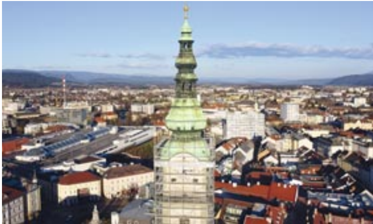
So haben die Arbeiten im Frühling des Vorjahres begonnen.