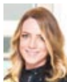
Dipl. soz. Paed.

Für jene 15 Soldaten, die an der Schießstätte Kreuzberg durch die NS Militärjustiz hingerichtet wurden, soll im Bereich der Hinrichtungsstätte ein Gedenkstein errichtet werden.