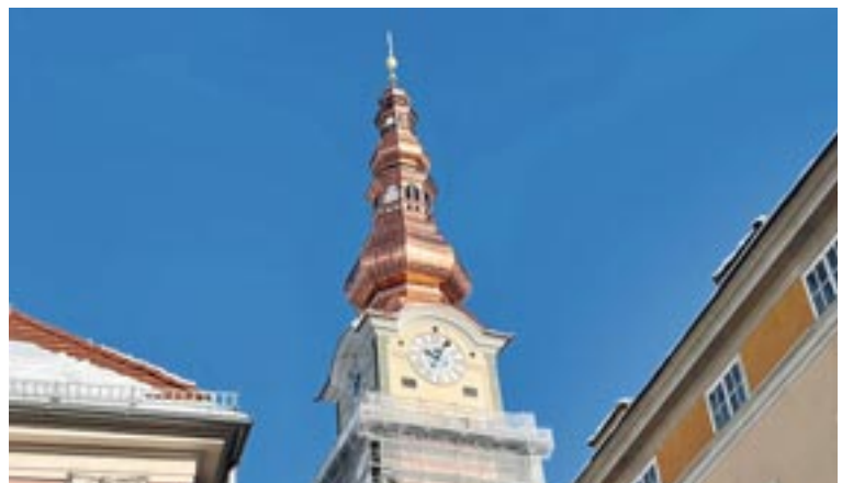
Herrlich glänzt das Dach jetzt wieder im Sonnenschein.