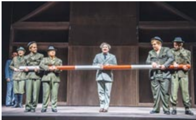
Unterhalt-samer Theater-abend: „Figaro lässt sich scheiden“ im Stadt-theater.