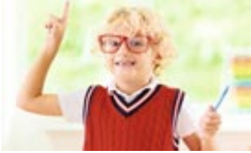
Kinder und Jugendliche schreiben für Kinder und Jugendliche