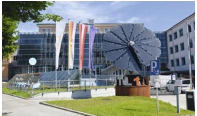
Der Strom aus den PV-Anlagen bei der HTL-Lastenstraße soll künftig gespeichert und unter anderem für E-Ladestationen verwendet werden.

Durch das derzeit ohnehin reduzierte Abendleben sowie aufgrund einer noch nicht optimal entwickelten digitalen Buchungsmöglichkeit konnten die Erwartungen jedoch bisher nicht erfüllt werden. Daher wird das Pilotprojekt vorerst eingestellt und das derzeitige Abend-Buslinienprogramm beibehalten. Sobald sich das gesellschaftliche Leben normalisiert hat ist – so Verkehrsreferentin Stadträtin Sandra Wassermann – ein neuerlicher, adaptierter Probetrieb geplant.