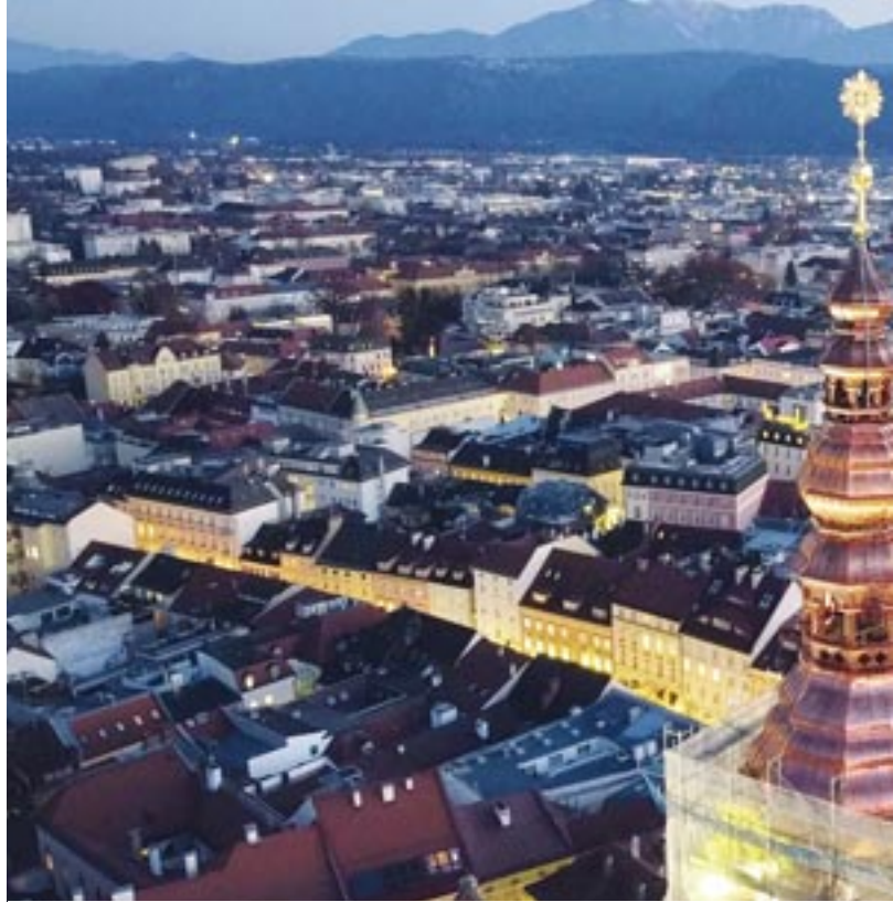
Was für ein Anblick – und Ausblick: Der Stadtpfarrturm thront nun mit seinem neuen