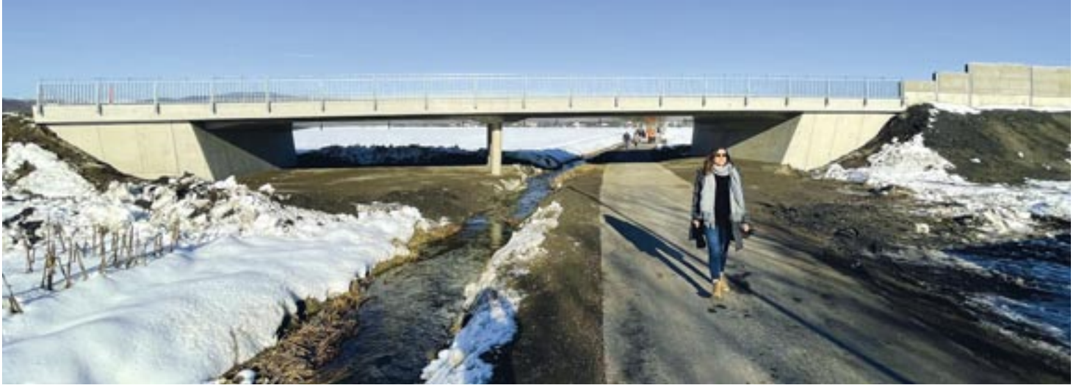
Der markanteste Teil der neuen Nordspange ist die Verkehrsbrücke über den Geh- und Radweg. Sobald es die Witterung zulässt, wird die Gestaltung unter der Brücke durchgeführt.