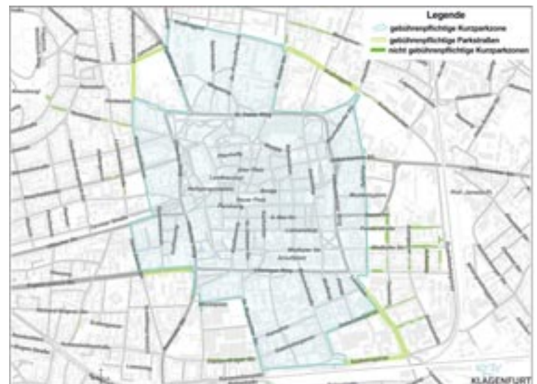
Die Parkzonen von Klagenfurt auf einen Blick. Grafik: SK

Weitere Informationen findet man auf: klagenfurt.at/parken