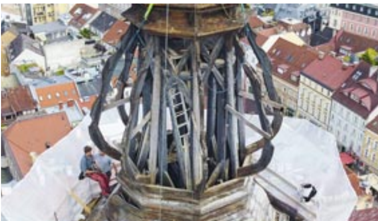
Das Innere des Turmdaches musste grundlegend erneuert werden.