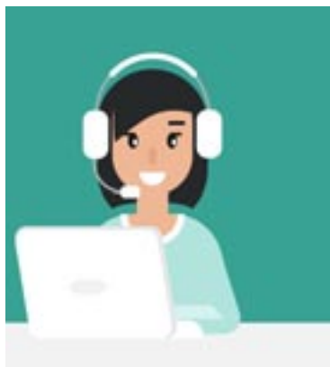
Eltern erhalten beim Österreichischen Jugendrotkreuz fachliche und kompetente Online-Unterstützung.

Angebot. Das Österreichische Jugendrotkreuz, Mitglied der Plattform Prävention der Stadt Klagenfurt, hat für Eltern ein spezielles Programm mit Online-Kursen entwickelt, die praktische Tipps zur psychischen Gesundheit geben und wichtige Hintergrundinformationen zu diversen Erkrankungen – gerade in Pandemiezeiten ein wichtiges Angebot.