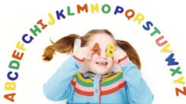
Die Wahl der Volksschule sollte gut überlegt sein.

sen Gründen nachholen müssen oder eignet sich für jene, die in einem Asylverfahren sind und mit dem Abschluss ihre Chancen, einen Arbeitsplatz zu bekommen, verbessern möchten. Dazu gibt es zwei Infoveranstaltungen: Am 16. Februar, 18 Uhr, online via Zoom, sowie am 21. Februar, 17 Uhr im ÖGB Saal, Bahnhofstraße 44. Mehr auf www.vhsktn.at