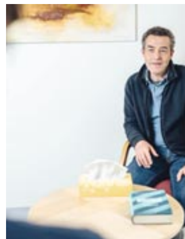
Die Männerberatung der Caritas Kärnten ist mit Hauptsitz in Klagenfurt und einer Zweigstelle in Villach die einzige ihrer Art in Kärnten.

Infos unter 0463 / 599 500 oder per Mail unter maennerberatung@caritas-kaernten.at